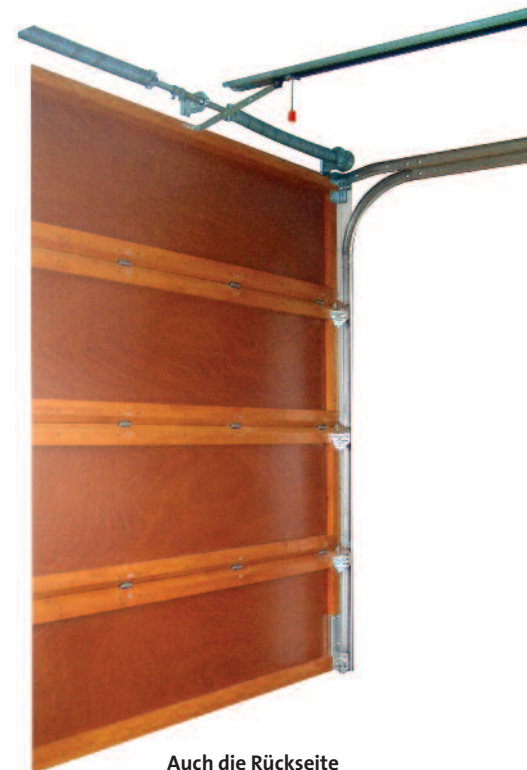
Auch die Rückseite des Tores ist aus Holz