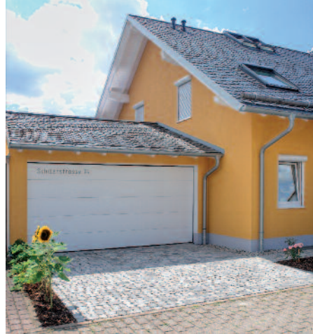
Lackiertes Sektionaltor aus Holz

Holz als Werkstoff lässt sich optimal verarbeiten und verleiht Ihrem Haus einen besonderen Charakter. Dazu kommen Umweltfreundlichkeit, exzellente Wärmedämmung und schier unbegrenzte Gestaltungsmöglichkeiten.