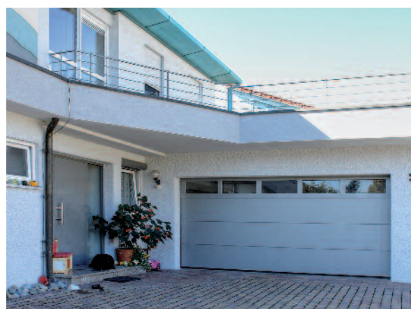
Lackiertes Sektionaltor aus Holz mit Lichtband