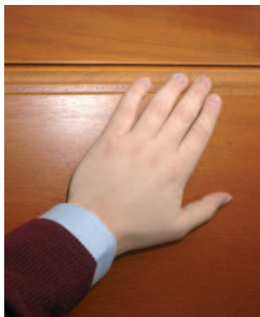
Torsektion mit Finger- Einklemmschutz