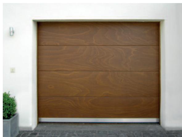
Sektionaltor aus Okoume mit Edelstahlsockel