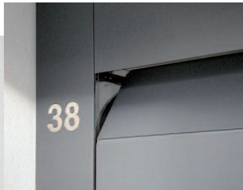
Tor und Zarge bilden eine Fläche