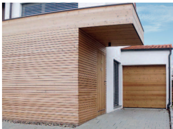
Sektionaltor aus Lärche-Mehrschichtplatte