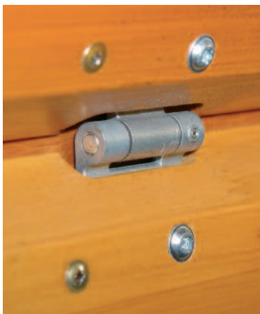
Solide Metallscharniere für lange Lebensdauer