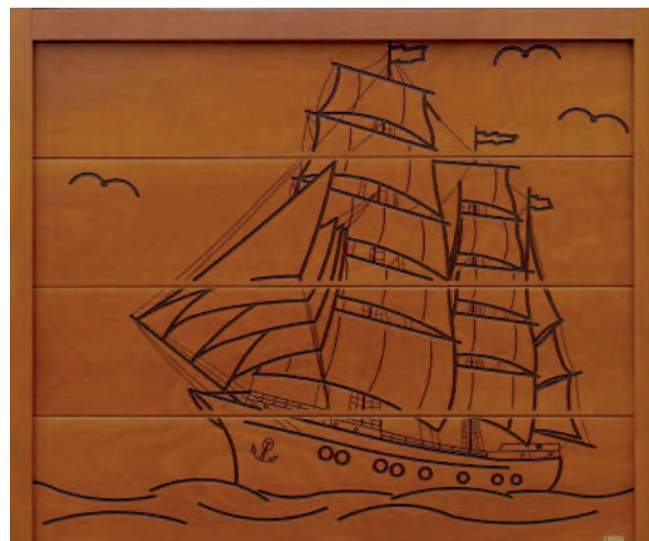
Sektionaltor mit Motivfräsung

Jedes Pfullendorfer ist ein Einzelstück. Bei der Gestaltung Ihrer Torfläche können Sie auf eine große Zahl bewährter Pfullendorfer Designvorschläge zurückgreifen. Sie können dem Tor aber auch eine persönliche Note verleihen und die Torfläche selbst gestalten. Viele Kunden nutzen die Chance, auf diese Weise Ihr ganz individuelles Sektionaltor zu erhalten.