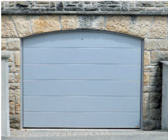
Holz-Sektionaltor mit Stichbogen

Ob Sie nur ein neues Element stilvoll in die alte Bausubstanz integrieren oder Ihrem Haus ein komplett neues Aussehen geben wollen: Ein Pfullendorfer Sektionaltor aus Holz passt immer.