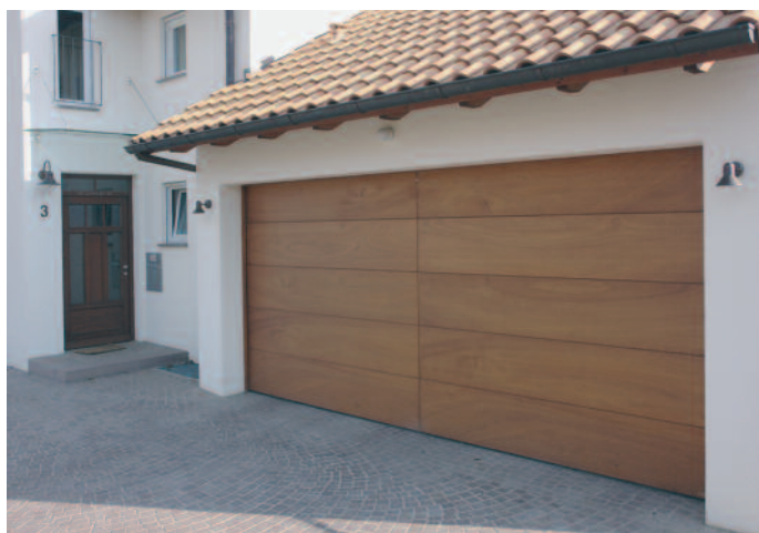
Sektionaltor aus Okoume Bootsbauplatte