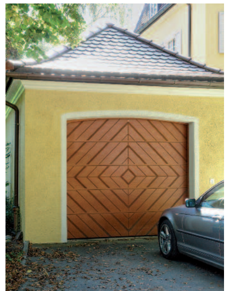
Sektionaltor aus Okoume Bootsbauplatte