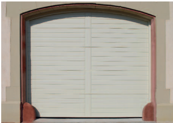
Tor-Renovierung bei einem denkmalgeschützten Haus