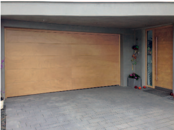
Sektionaltor aus Okoume Bootsbauplatte